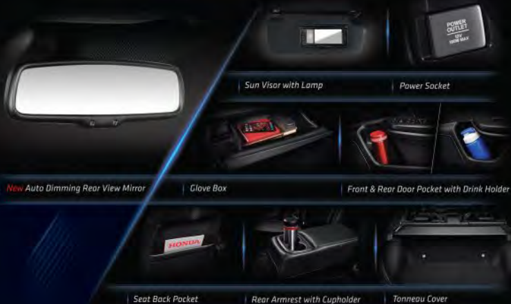
New Auto Dimming Rear View Mirror