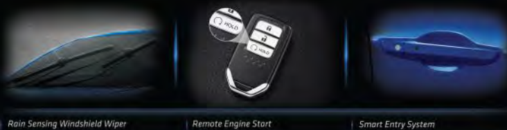
Rain Sensing Windshield Wiper