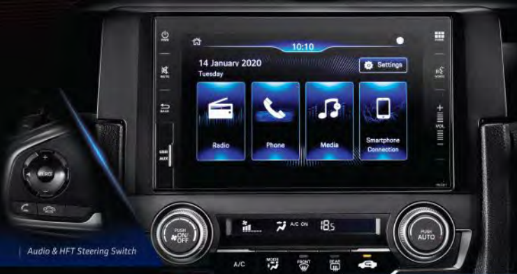
Audio & HFT Steering Switch

NEW 7" CAPACITIVE TOUCHSCREEN DISPLAY AUDIO