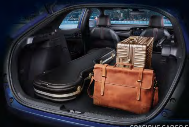
SPACIOUS CARGO SPACE

NEW 7" CAPACITIVE TOUCHSCREEN DISPLAY AUDIO