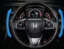
Dual Pinion EPS